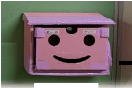
楽しい四のポスト